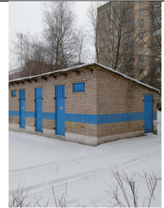
сарай для мусора: